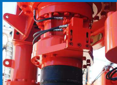
■ 油圧オートチャック機構