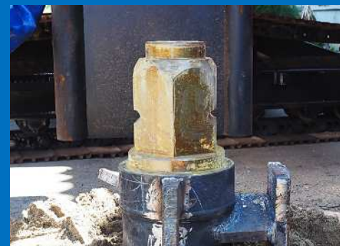
■ 折れ防止特殊スクリージョイント